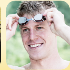
Clemens Rapp Schwimmen Deutscher Meister Europameister (Staffel) Weltmeisterschafts- sechster (Staffel) Olympia 2012 (Staffel) 4. Platz Olympia 2016 (Staffel) 6. Platz